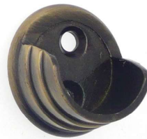
Saillie 15 mm