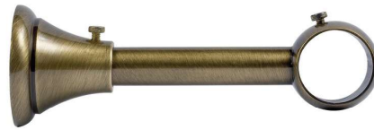
Saillie 125 mm