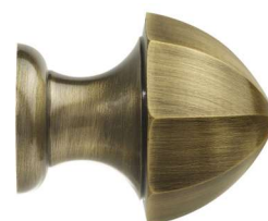
Saillie 40 mm | Hauteur 32 mm | à vis