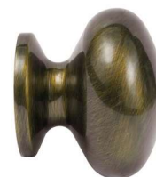
Saillie 27 mm | Hauteur 32 mm | à vis