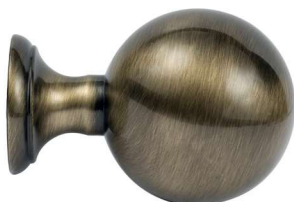
Saillie 44 mm | Hauteur 33 mm | à vis

Veillez à vérifier que votre tringle soit dotée d'embout rentrant pour l'installation de vos embouts à vis - retrouvez les références selon le choix du tube et diamètre en page 146 et 147