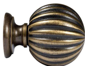
Saillie 45 mm | Hauteur 36 mm | à vis