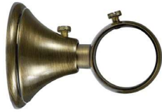
Saillie 55 mm