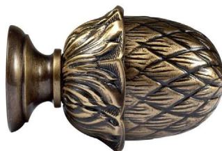
Saillie 50 mm | Hauteur 36 mm | à vis