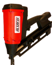
D 90 G2