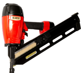
D 38/100 P1